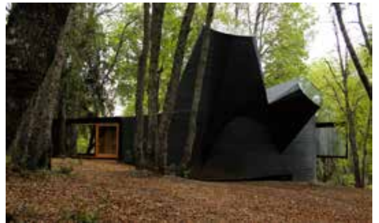
House for the Poem of the Right Angle, Amérique du Sud, 2014