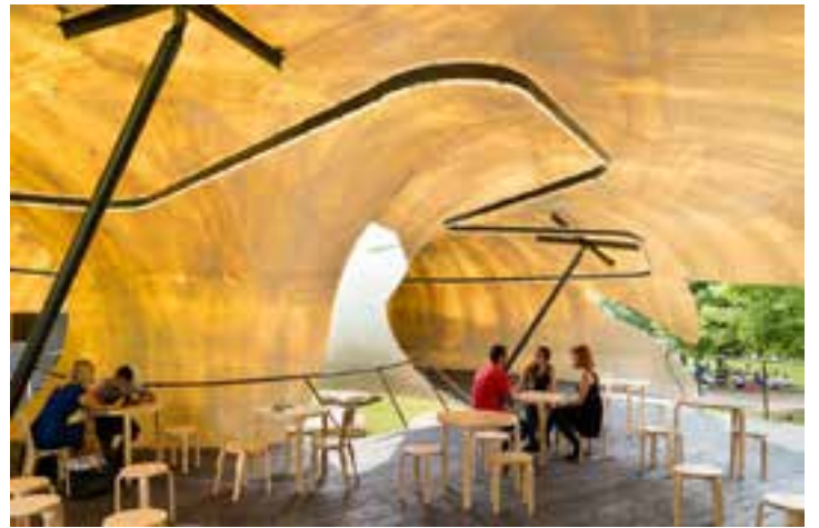
Pavillon d'été de la Serpentine Gallery, Londres, 2014